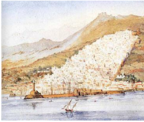
Aquarelle de Théodore GUDIN - 1830