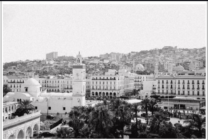
Arrivée à Alger la Blanche