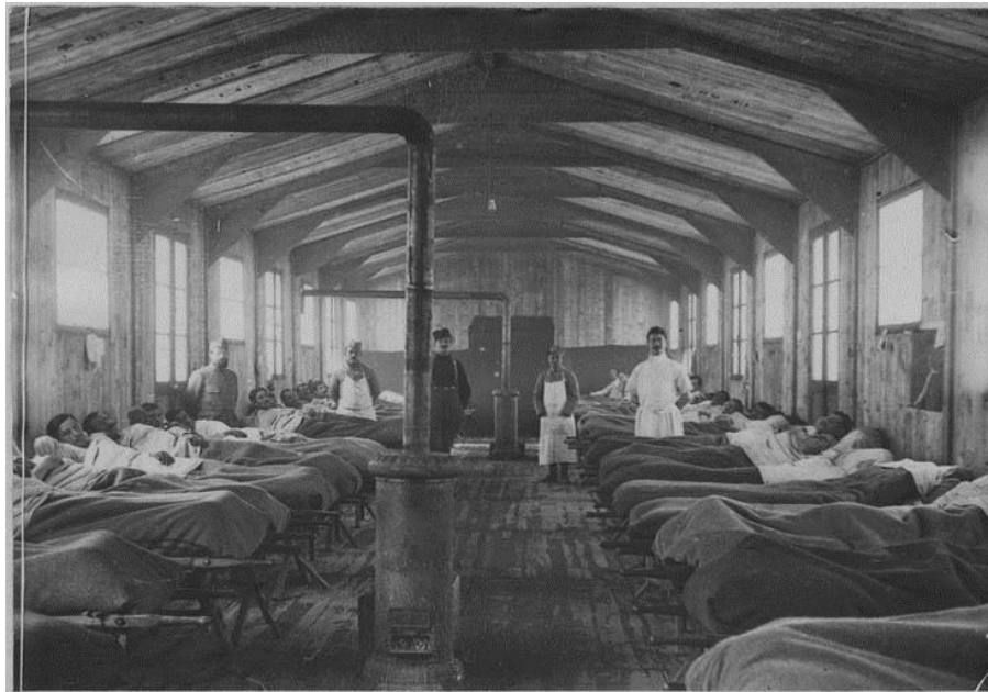
Les hôpitaux du front dans le secteur de Florina (février 1918).

Vue intérieure d'une baraque Cochet