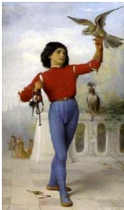
Jeune fauconnier (1867)