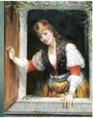
Orientale à sa fenêtre (1879)