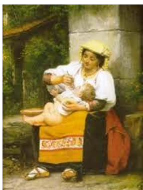
Italienne donnant la soupe à son enfant (1873)