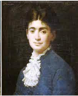
Portrait de femme (1877)