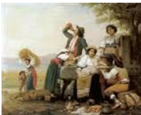
Déjeuner d'une famille paysanne napolitaine (1872)