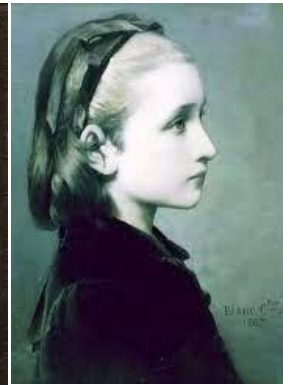
Tête de fille (1867)