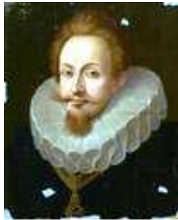
Portrait du duc de Lionne