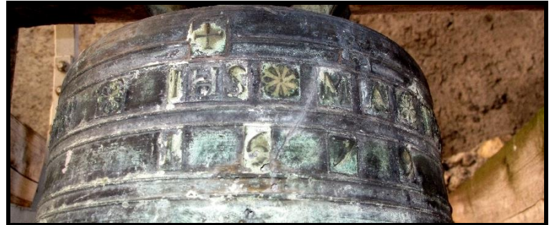
Nombreux médaillons gravés tout autour de la cloche, inscription JHS et citation latine

Cette cloche dispose d'une roue pour la volée, qui n'est plus utilisée, et seul le mécanisme électrique met en marche un marteau pour sonner les heures.