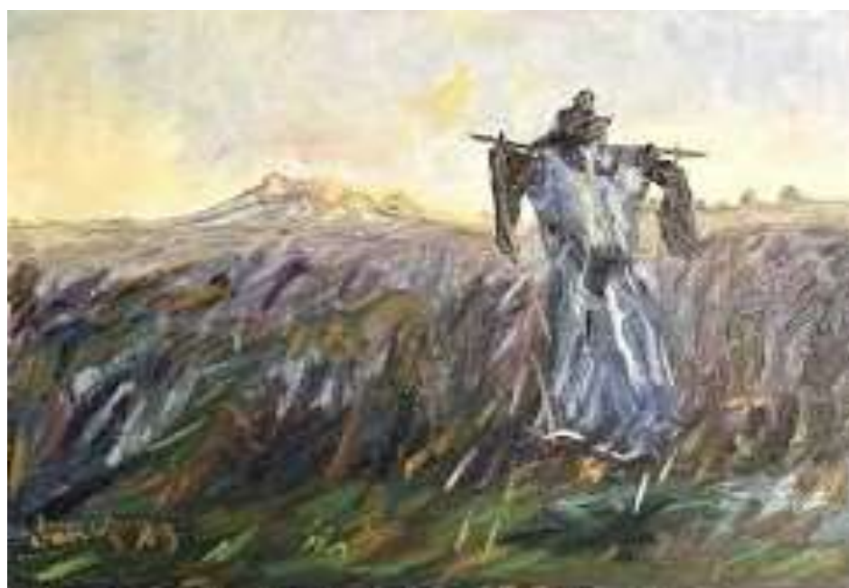
Epouvantail aux moineaux 1978.

Au fil de ses dessins, de ses sculptures et de ses installations, il a donné vie à sa propre représentation d'un monde ouvrier souvent âpre mais toujours tendre.