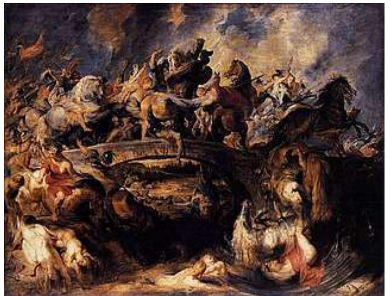
La Bataille des amazones Rubens (1617)

En parallèle, une vision panhellénique demeure, qui les montre comme des héroïnes valeureuses et admirables.