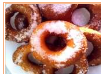
aperçu après cuisson

Second événement : VENTE des SAINT-GEORGES* le dimanche matin 26 avril 2026 sur la place du marché.