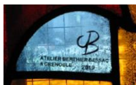
Les vitraux de l'atelier grenoblois Berthier Bessac inaugurés le 15 juin 2019.