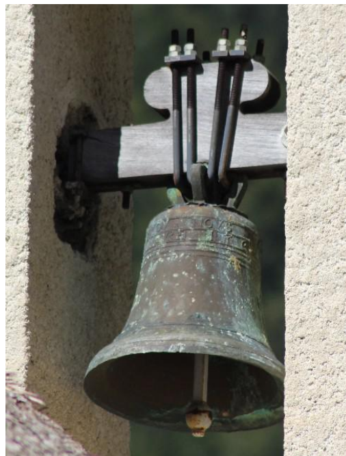
(date 176* - le dernier chiffre n'est pas visible)

Cette cloche ancienne n'est pas répertoriée dans l'Inventaire des inscriptions campanaires des églises de l'Isère (G. Vallier - 1886)