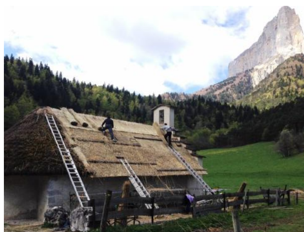
Réfection du toit