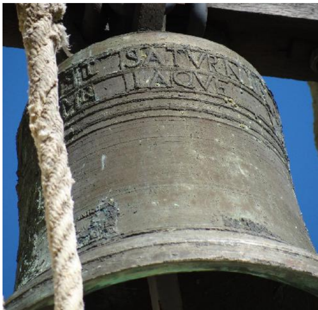
Cloche du 16e siècle Fondeur Nicolas Bonvie