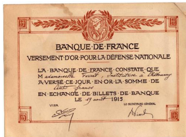
2 documents au nom de Lucienne FERRAT (prêtés par Frédérique FERRAT- Clelles)