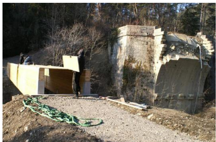
2012 – Etablissement d'une passerelle provisoire