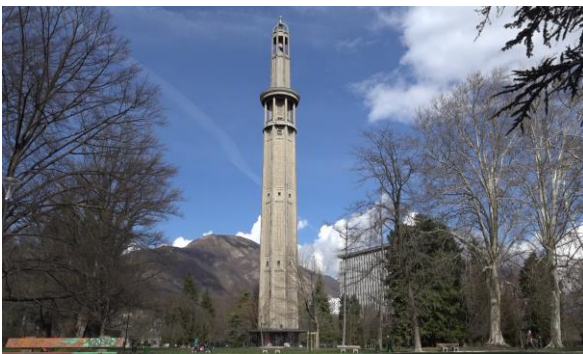
Tour Perret - parc Paul Mistral -Grenoble

Les nouvelles technologies, innovations du béton du futur terminent ce documentaire.