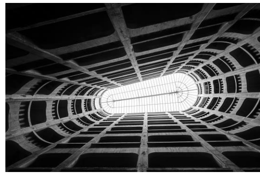
Garage hélicoïdal - rue Bressieux -Grenoble