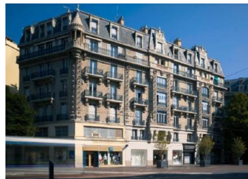
Immeuble - rue Félix Poulat - Grenoble