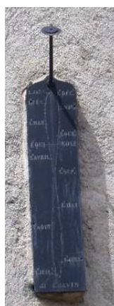
St Jean d'Hérans