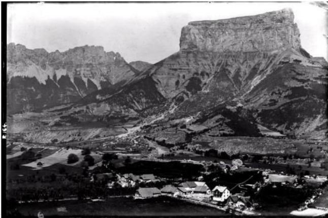
Photographie prise le 1 juin 1886 par l'opérateur-photographe CHARLEMAGNE.