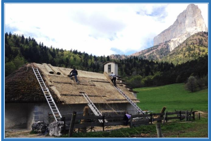
Réfection du toit