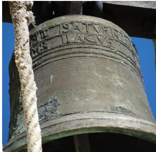
2 lignes d'inscriptions