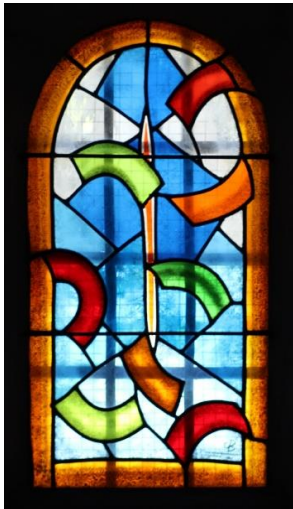
Un des vitraux inaugurés en juin 2019, réalisés par l'atelier grenoblois Berthier et Bessac.