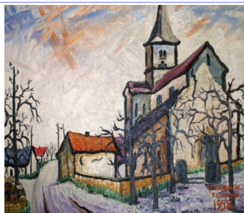
St Maurice sur Vingeanne (Côte d'Or)