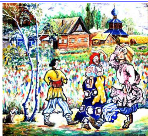
Danse au village

Les fresques murales peintes par Lyoubovin sont aujourd'hui très dégradées