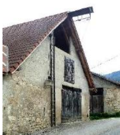
Les grandes lucarnes du Trièves étaient utilisées pour monter le foin sous le toit quand il n'existait pas de montoir, à l'aide d'un système de cables et de poulies.