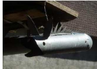
Des gouttières découpées aux formes animales...