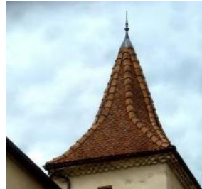
<<<<< toit de tour carrée, à 8 pans...