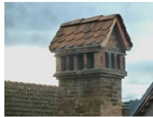
... cheminée de l'ancien four banal de Clelles, seul vestige visible du lieu.