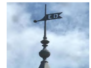
Deux girouettes : - 1931 sur l'une - ED sur l'autre

Toutes les photographies sont prises à Clelles.