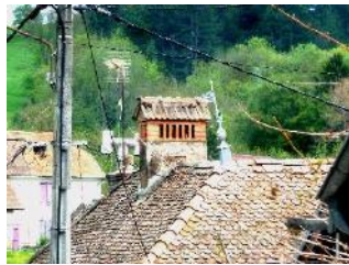
Des cheminées typiques ... d'origine ou restaurées ...