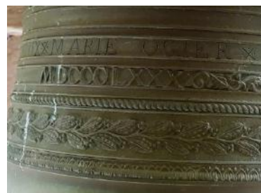
Date 1880 - cordons de décor