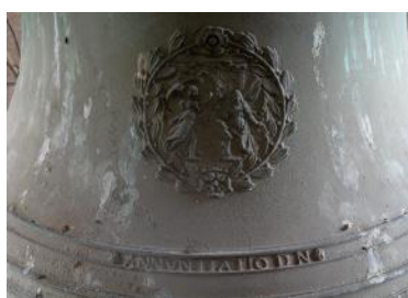
Décor : Annonciation