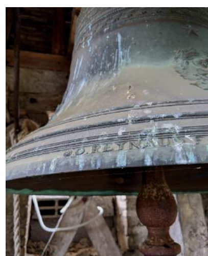
Oronce REYNAUD fondeur