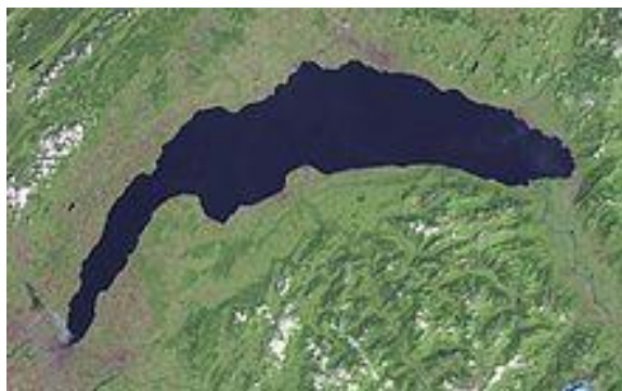
Le Léman vu d'avion